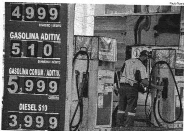
Aumento no preço da gasolina deixa motoristas de aplicativos preocupados e no prejuízo com suas corridas

Com o aumento da gasolina, motoristas de aplicativos que alugam veículos para trabalhar se prejudicam e, não tendo como arcar com os custos do aluguel, ficando ina-