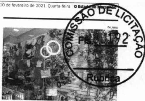
Adeços de Carnaval nas prateleiras, só o que sobrou do ano passado

Desde o início do ano, a Petrobras já elevou em 22% o preço da gasolina - em dezembro, o litro custava R$ 1,84. Já o diesel subiu 10,9%. Com as novas alçadas, o litro da gasolina passou a custar mais caro que o do diesel às distribuidoras. ■